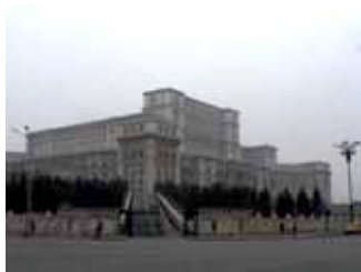
Casa del Pueblo